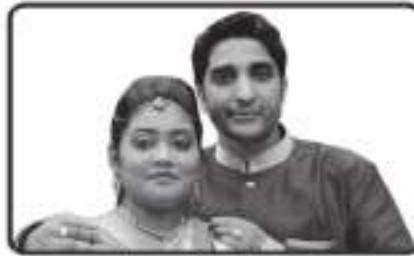
અ.સૌ. પુર્વી રીતેશ છાડવા